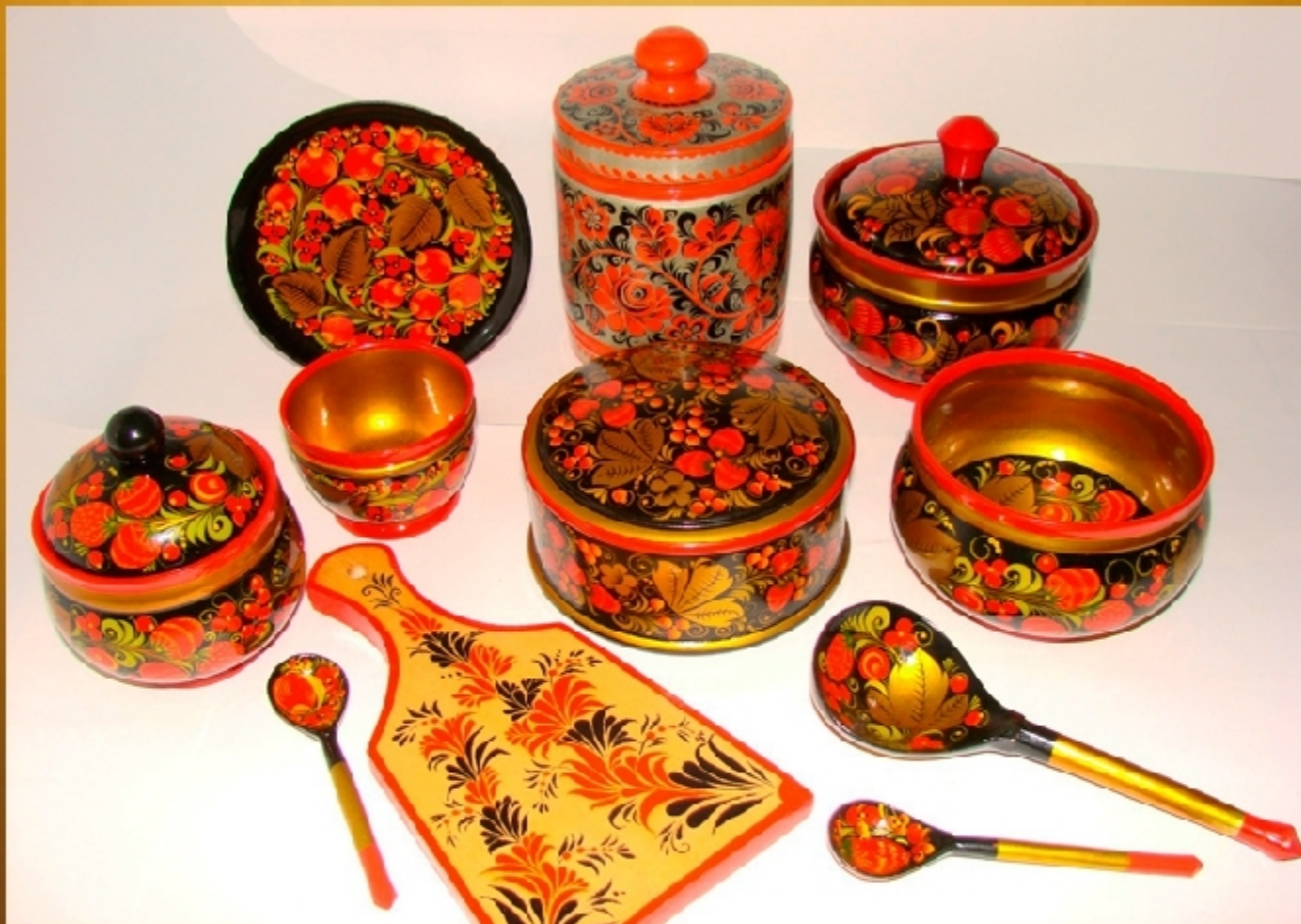
Рисунок Хохлома привлекает своей красочностью и яркостью. Мастера подбирают для узора такие цвета красок, которые хорошо сочетаются с золотым фоном - красный, черный, зелёный, коричневый, жёлтый.

Это особенности хохломской росписи, но есть и свои правила.