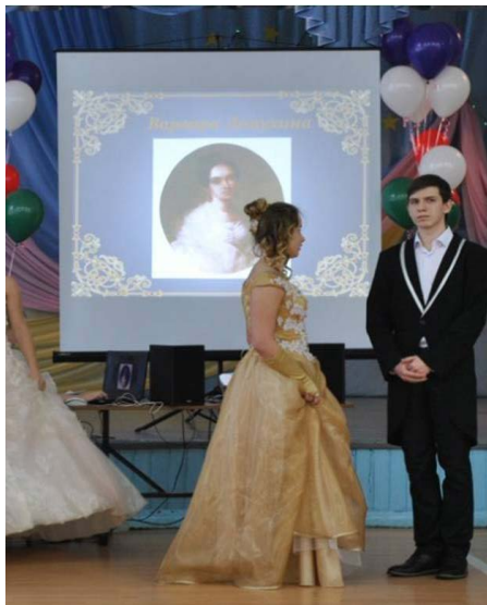
Сцена из «Маскарада»

Музыка, бальные платья, вальсирующие пары, романсы на стихи М.Ю. Лермонтова, игра в живые картины... Старшеклассники школ города 3 февраля открыли Год литературы Лермонтовским балом. Подготовка к нему заняла около четырех месяцев: ребята не просто разучивали стихи, вальс, полонез, готовили платья и костюмы, но и вместе с учителями находили мате риал о музах русского поэта, стараясь подать свои находки интересно. Равнодушных лиц не было! Завершился бал Венским вальсом.