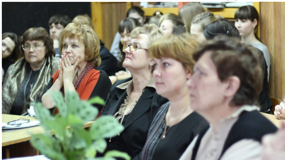
Почетные гости в школьном музее.