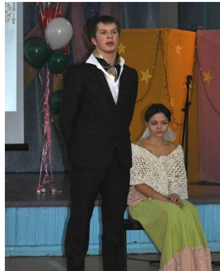
Печорин и княжна Мери