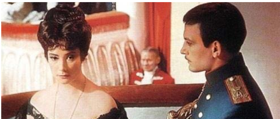
Анна и Вронский. Кадр из фильма, СССР, 1967 год

Моя подруга пошла на фильм «Великий уравнитель» лишь из-за Хлое