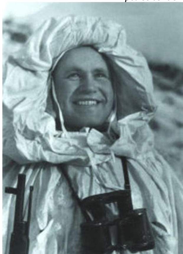
Зайцев Василий Григорьевич