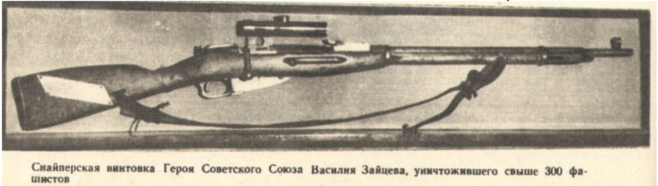
Снайперская винтовка Зайцева Василия Григорьевича