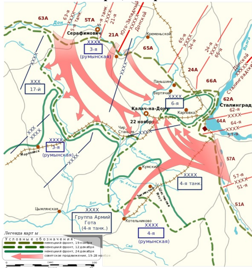
Сталинградская битва. Операция Уран.