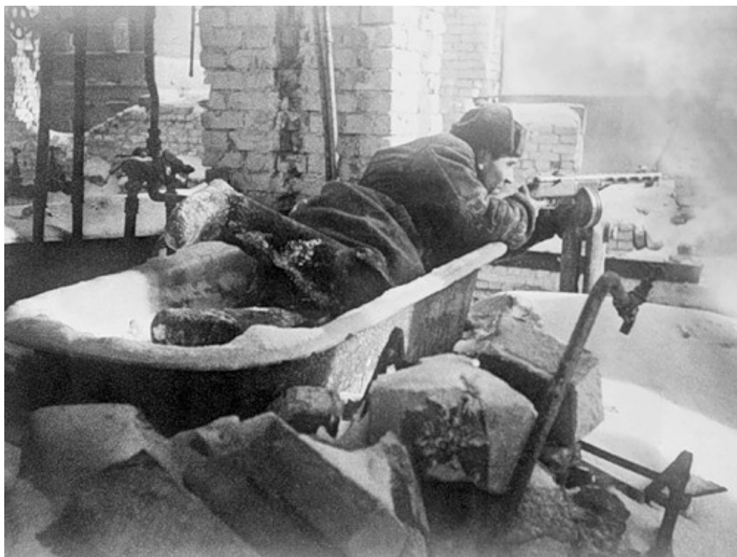
Позиция снайпера в разрушенном здании