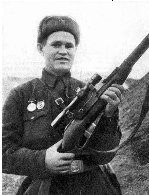
Зайцев Василий Григорьевич