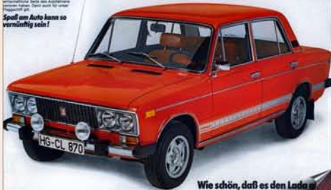
Wie schön, daß es den Lada