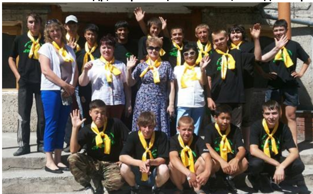
ОМВАД "Прометей" ГБОУ РХ НПО "ПУ-6"