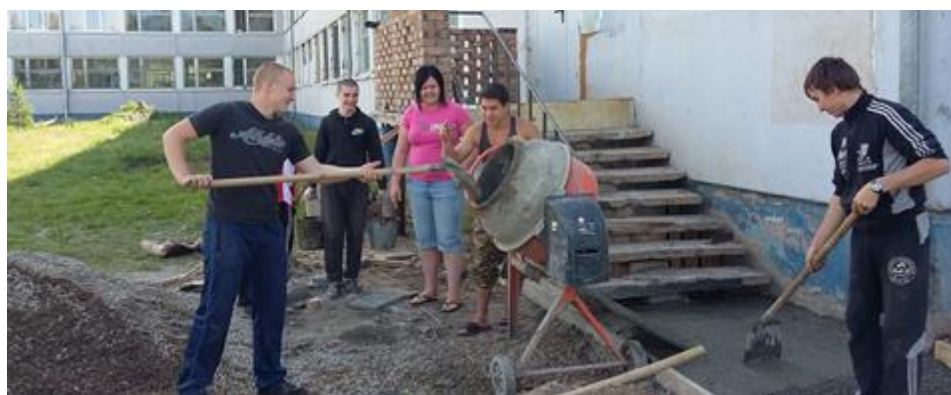
прохождение производственной практики обучающихся ГБОУ РХ НПО "ПУ-6", гр. 102. Объект: территория училища.

После получения теоретических знаний очень важно как можно быстрее окунуться в атмосферу трудовых будней.