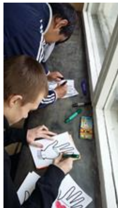
Участники акции: обучающиеся ГБОУ РХ НПО "ПУ-6"

В качестве листков для голосования была предложена нарисованная ладошка, на которой обучающиеся писали свои пожелания «Я голосую за...»