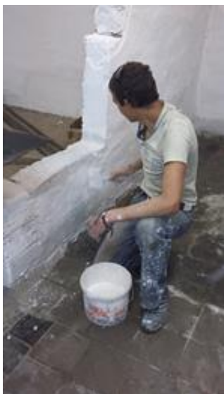
прохождение производственной практики обучающихся ГБОУ РХ НПО "ПУ-6", гр. 107 Объект: сварочные мастерские.