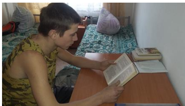
Участники акции: обучающиеся ГБОУ РХ НПО "ПУ-6"