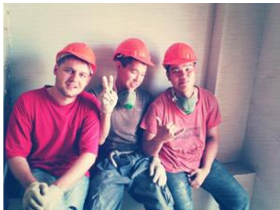
прохождение производственной практики обучающихся ГБОУ РХ НПО "ПУ-6", гр. 202

Сегодня рынок труда насытился специалистами, получившими дипломы вузов. Но на работе ценятся, прежде всего, профессионалы, готовые работать, а не только пытаться управлять рабочими. Вузы готовят теоретиков, а строительные училища и колледжи обучают специалистов, которые умеют и хотят работать.