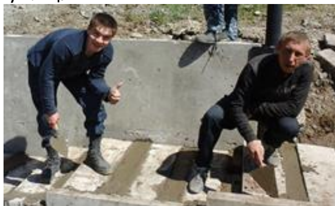
прохождение производственной практики обучающихся ГБОУ РХ НПО "ПУ-6", гр. 105. Объект: территория училища.

И уже в этом году наши ребята приобрели необходимый опыт работы, что позволит заложить прочный фундамент для дальнейшей успешной жизни.