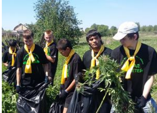
ОМВАД "Прометей" ГБОУ РХ НПО "ПУ-6" – ликвидация конопли.