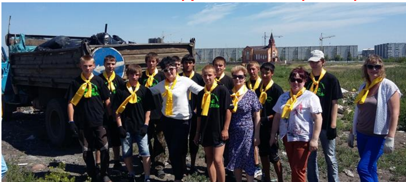
ОМВАД "Прометей" ГБОУ РХ НПО "ПУ-6"

а затем мешками грузили в автотранспорт.