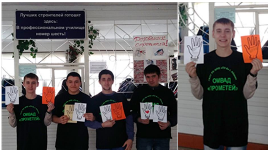
Участники акции: обучающиеся ГБОУ РХ НПО "ПУ-6"

Волонтёры пытались побудить обучающихся к размышлению о необходимости осознанного подхода к выбору, который они делают в ходе голосования.