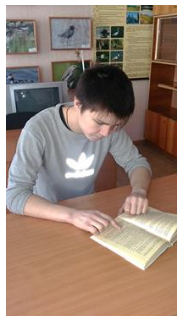
Участники акции: обучающиеся ГБОУ РХ НПО "ПУ-6"

В последние годы ощущается необходимость повышения роли книг в воспитательном воздействии на подрастающее поколение, осознания влияния чтения на процесс социализации личности в любом возрасте. Особую тревогу вызывает чтение молодежи, как самой динамичной социальной группы и самой активной категории читателей, нуждающейся в знаниях. Отсюда возрастает роль современной библиотеки, которая всегда являлась одновременно хранилищем информации и основой для образования и культуры.