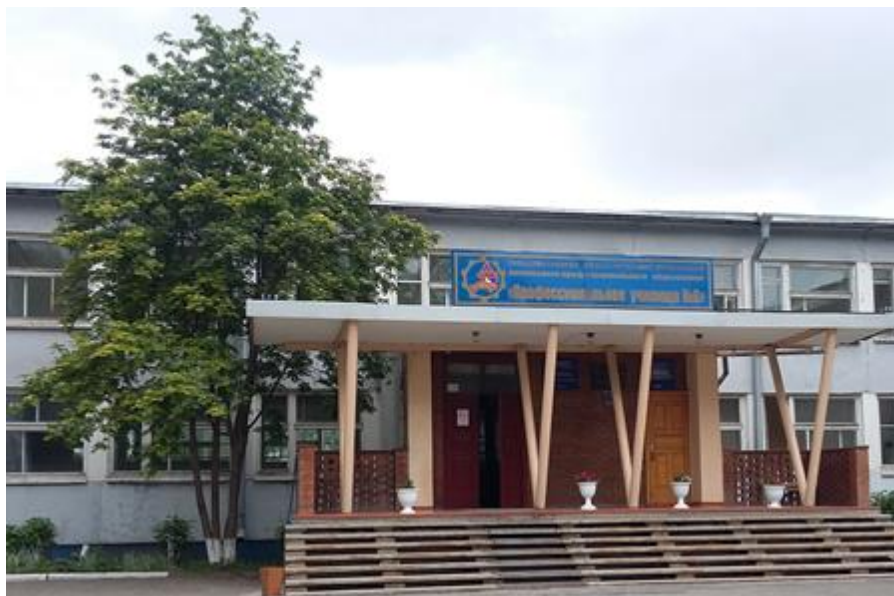
ГБОУ РХ НПО "ПУ-6"

Прохождение производственной практики составляет заключительную часть прохождения курса учебного процесса обучающимися и имеет целью качественную подготовку хороших строителей. По результатам прохождения производственной практики обучающиеся предоставляют обоснованный отчет о ее прохождении на объектах промышленного, гражданского, сельскохозяйственного строительства.