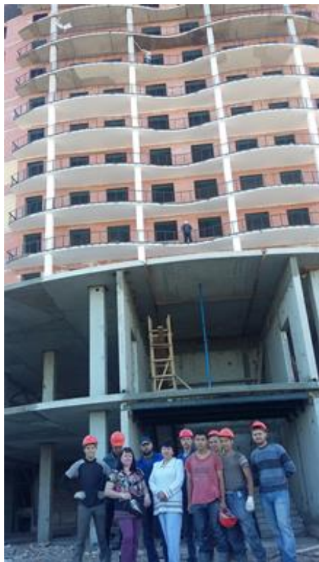
прохождение производственной практики обучающихся ГБОУ РХ НПО "ПУ-6", гр. 202.

Строители являются символом будущего. Рабочие данной профессии обеспечивают граждан нашей страны жильем.