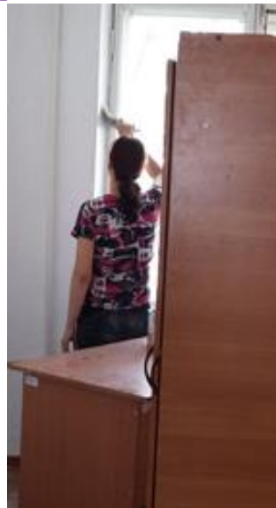
прохождение производственной практики обучающихся ГБОУ РХ НПО "ПУ-6", гр. 108 Объект: общежитие.