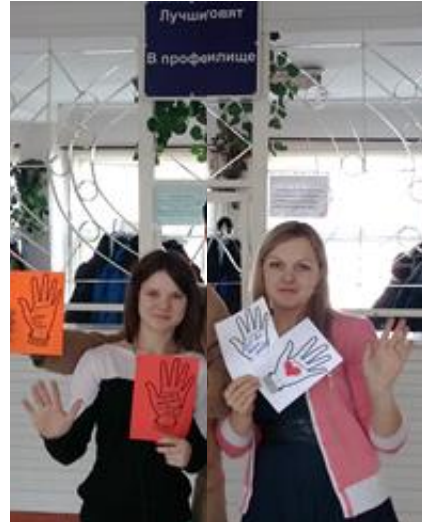
Участники акции: обучающиеся ГБОУ РХ НПО "ПУ-6"