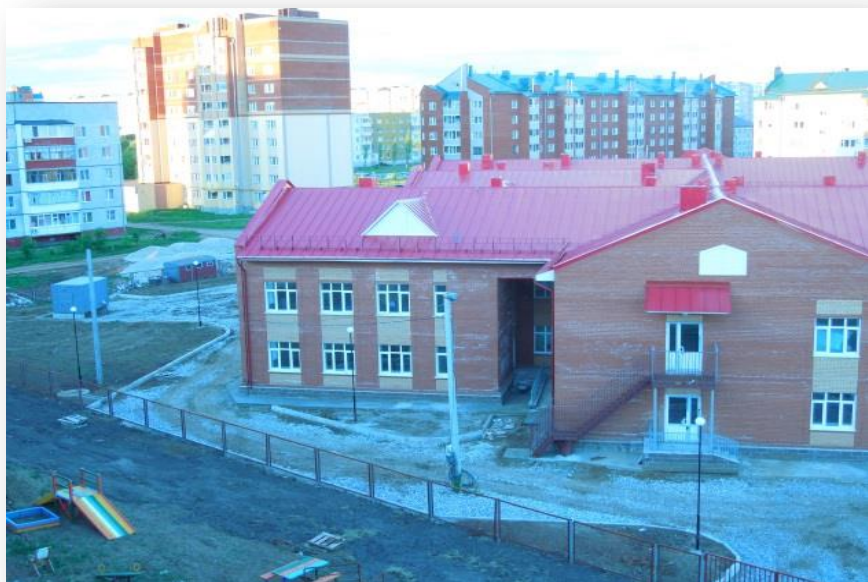
Детский сад 2013 год