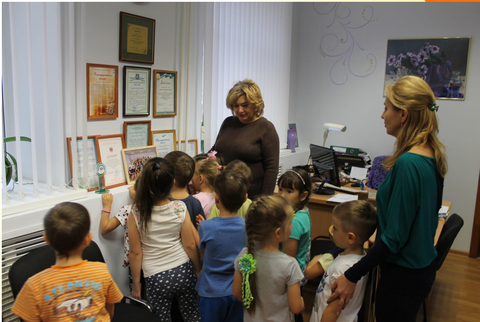
Кабинет заведующего детского сада