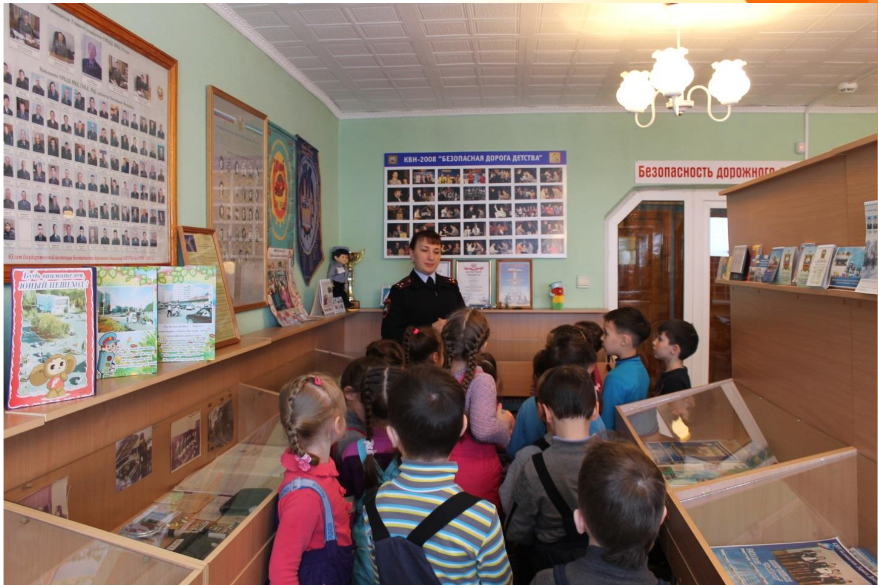
Экскурсия в музей ГИБДД г. Нефтекамск