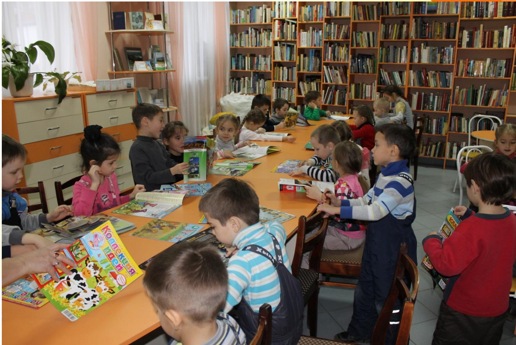
Экскурсия в библиотеку