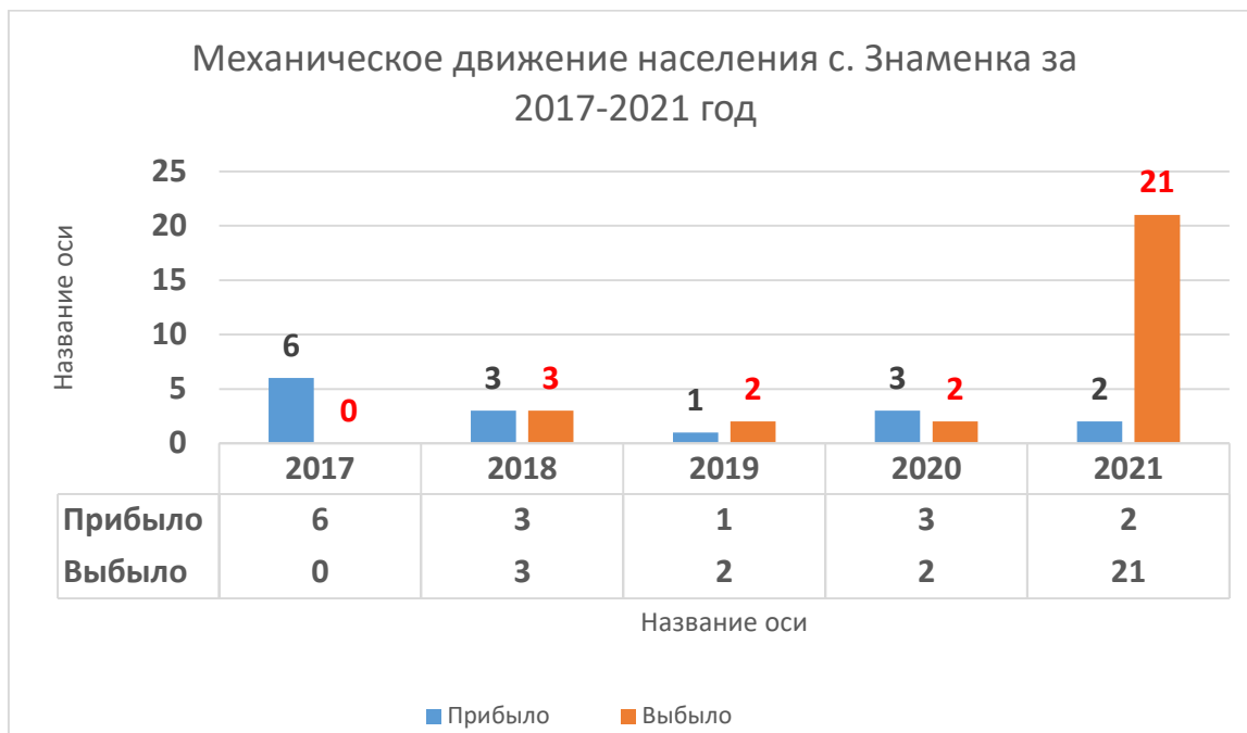
Диаграмма 2. Механическое движение населения с. Знаменка за 2017-2021 год

Данные «Паспорта социально-экономического положения муниципального образования сельское поселение «Знаменское» с. Знаменка»