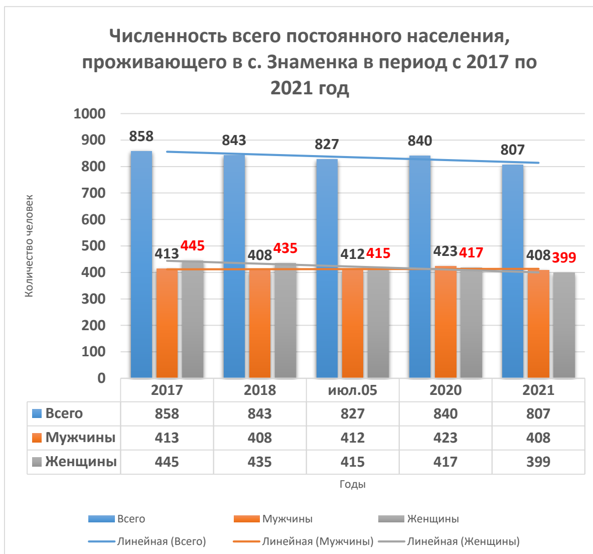
Диаграмма 1. Численность постоянного населения, проживающего в с. Знаменка в период с 2017 по 2021 год

Данные «Паспорта социально-экономического положения муниципального образования сельское поселение «Знаменское» с. Знаменка»