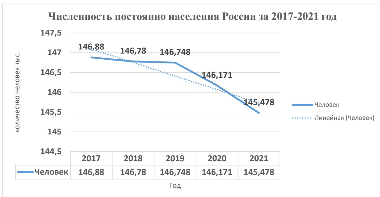
График 1. Численность постоянного населения России за 2017-2021 год