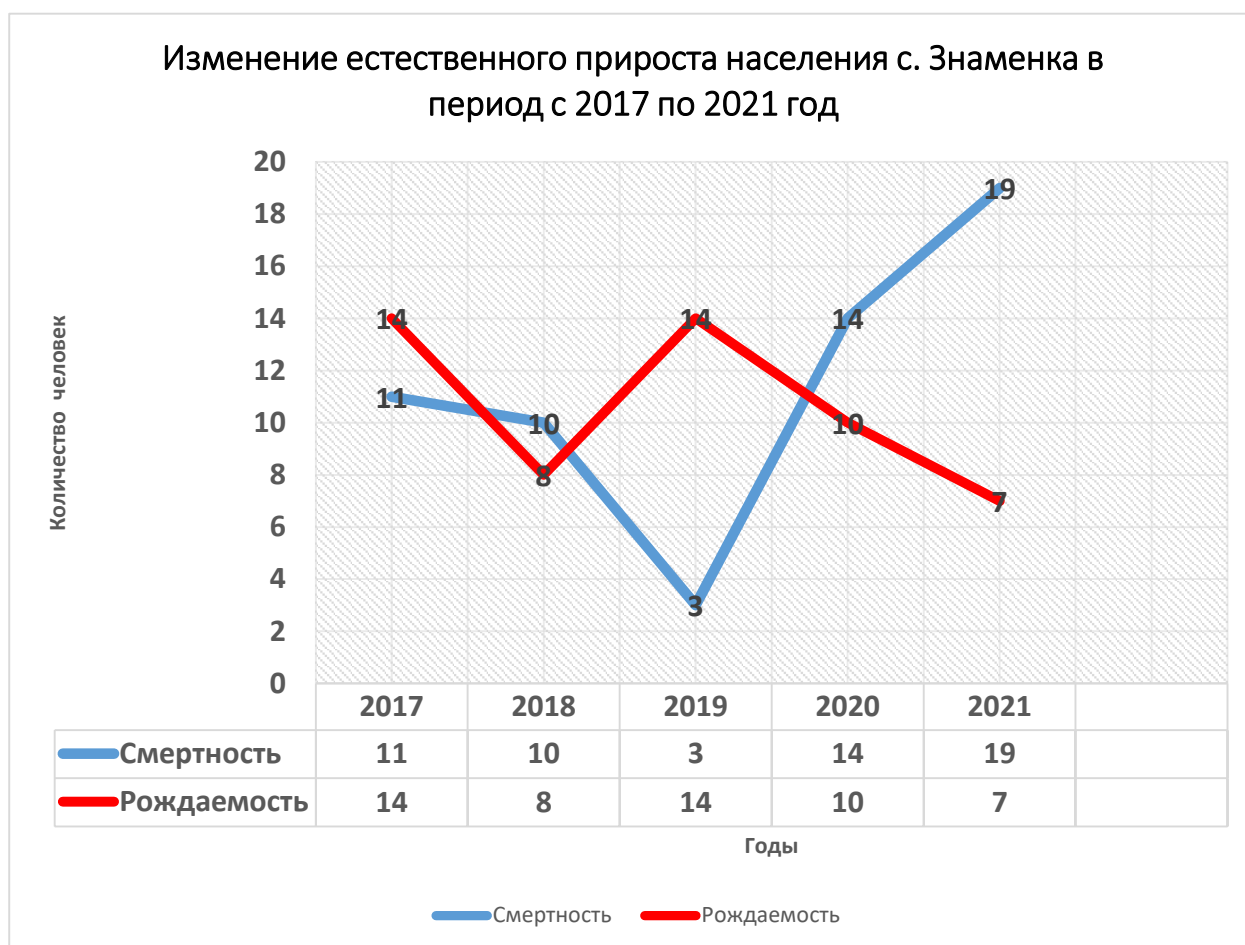
График 2. Изменение естественного прироста населения с. Знаменка в период с 2017 по 2021 год