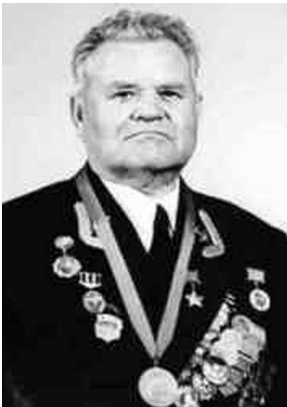
В. Г. Зайцев в послевоенное время