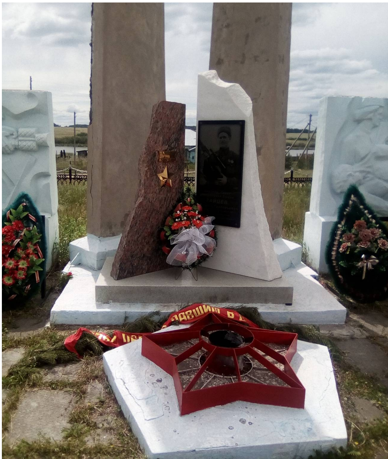
Памятник В. Г. Зайцеву в Еленинке