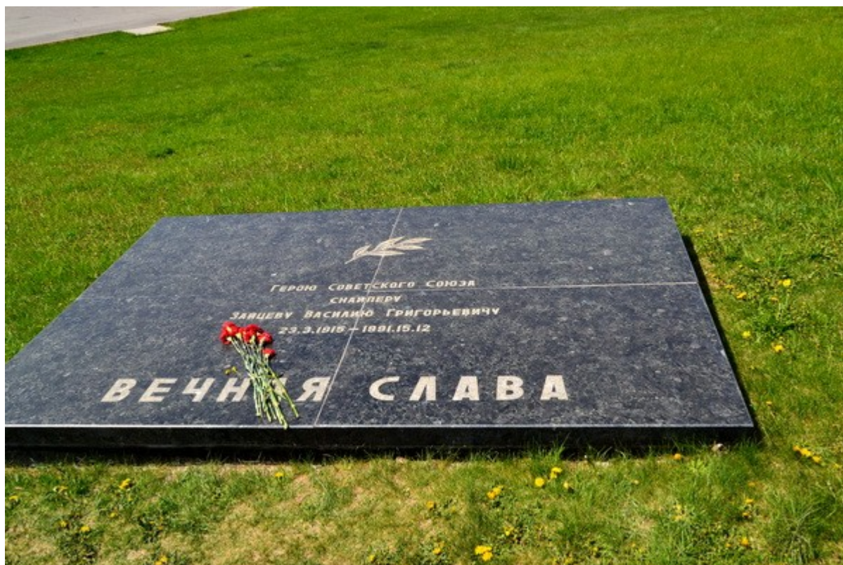
Могила В. Г. Зайцева на Мамаевом кургане