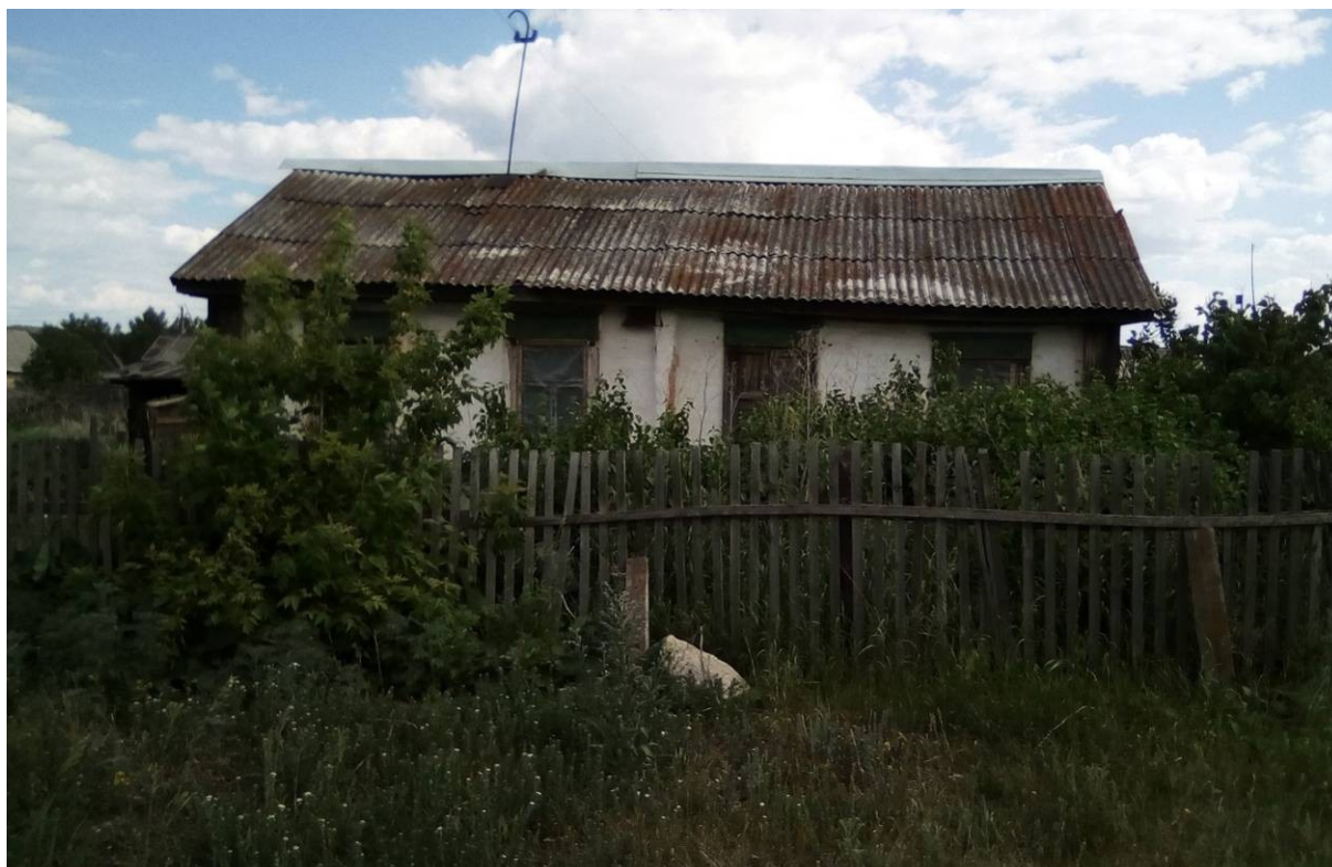
Дом В.Г. Зайцева (Вид с улицы)