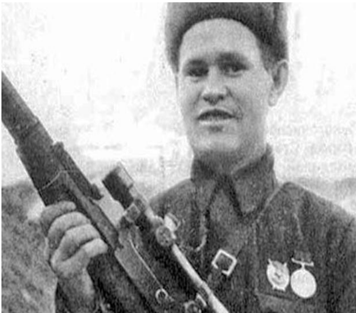
В. Г. Зайцев в период Сталинградской битвы