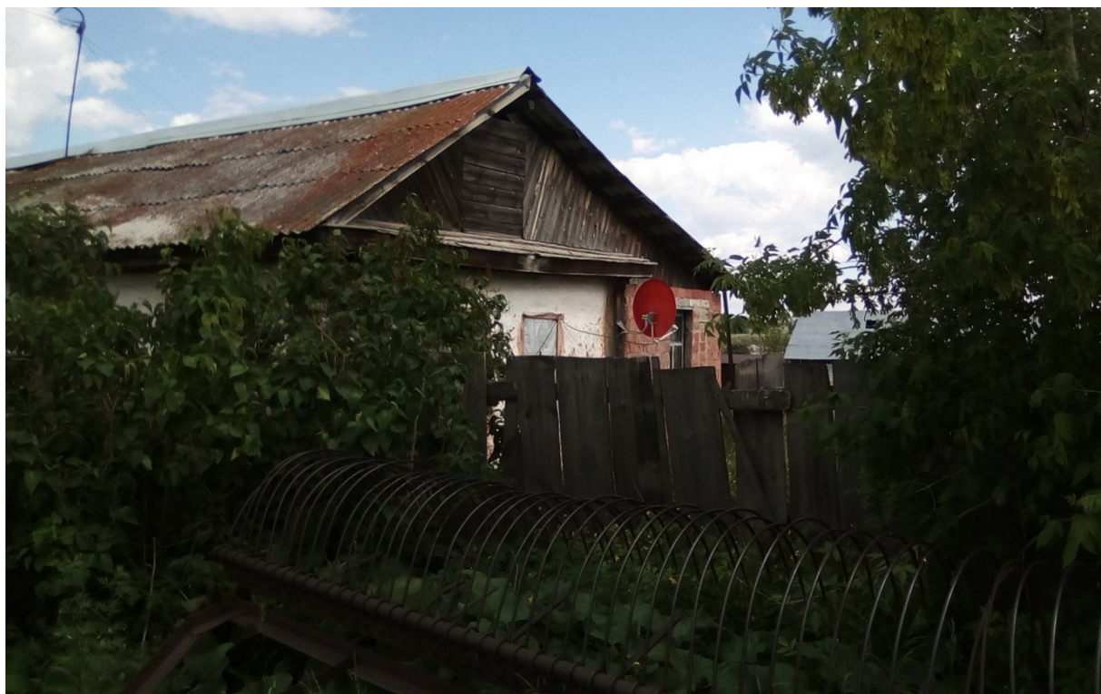
Дом В. Г. Зайцева (Вид с торца)