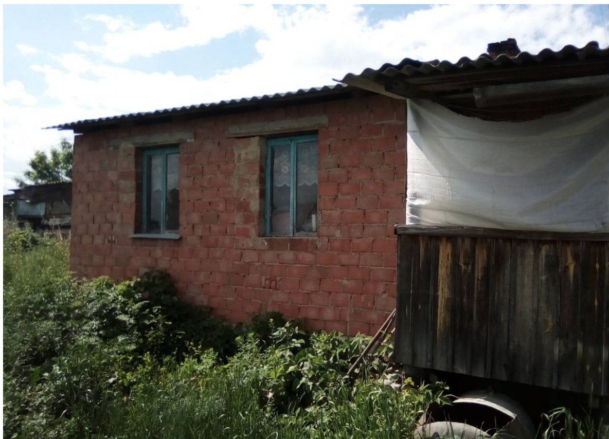
Дом В. Г. Зайцева (Вид со двора)