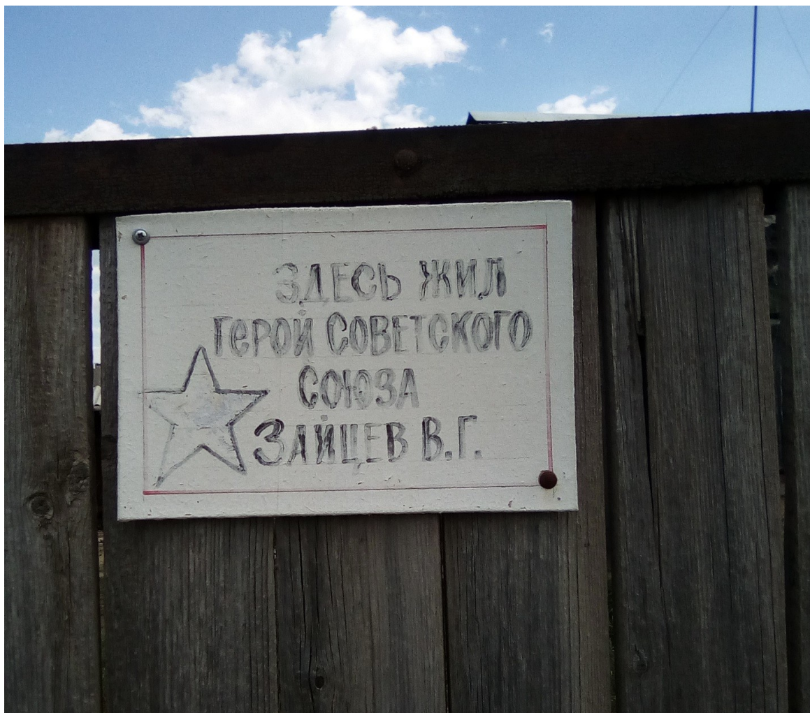
Фанерная табличка на воротах дома В. Г. Зайцева