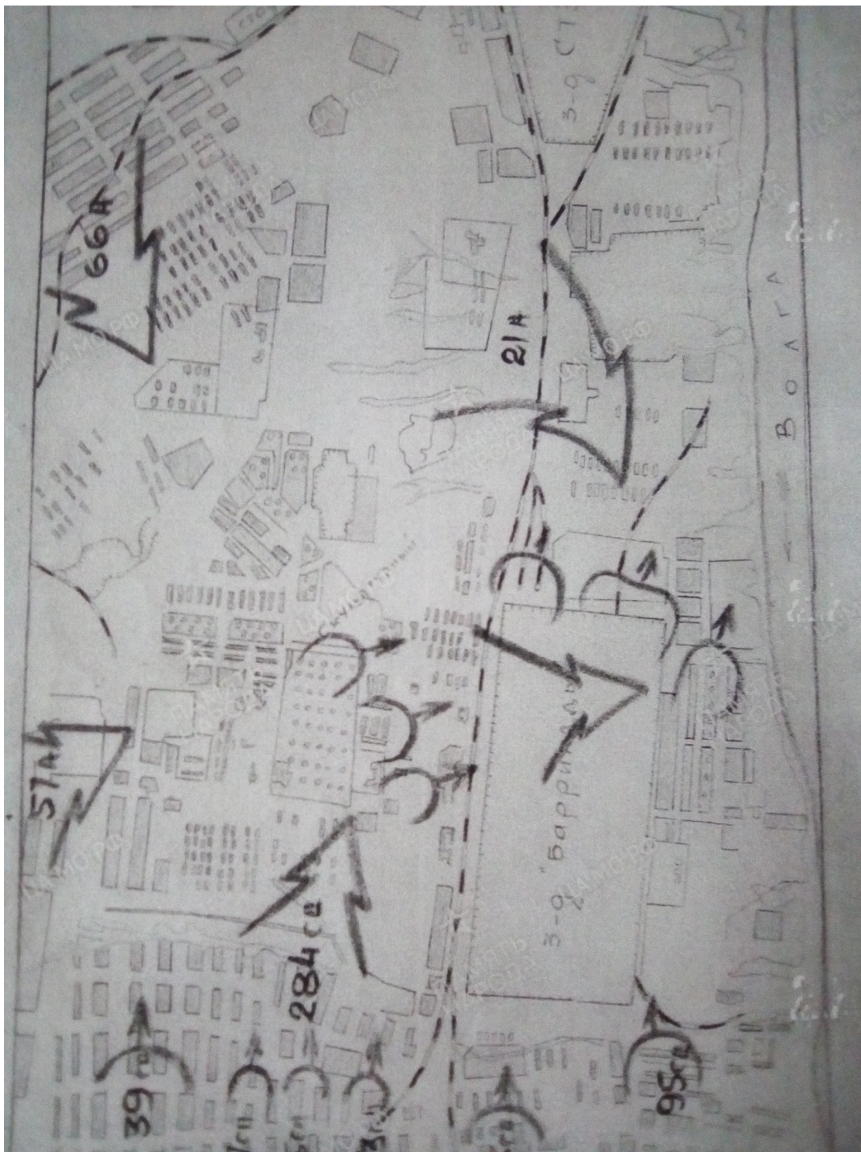
Карта сражений из сборника документов В. Г. Зайцева