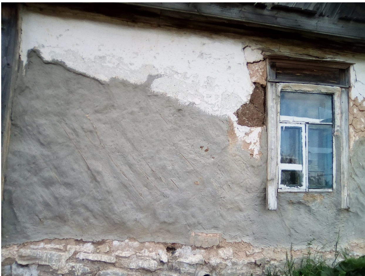
Дом В. Г. Зайцева (Вид со двора)