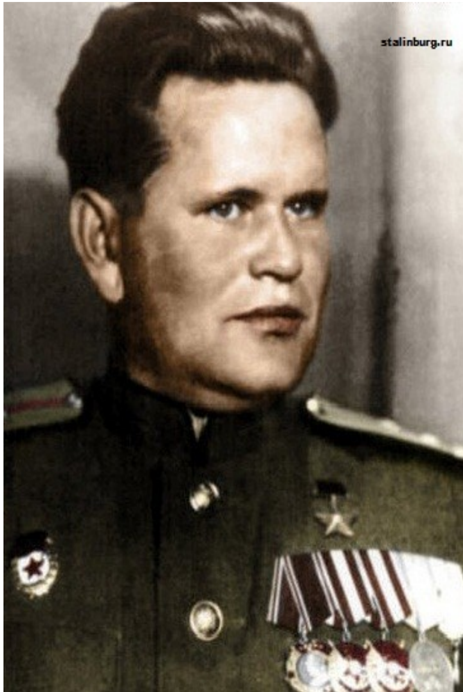
В. Г. Зайцев в годы ВОВ