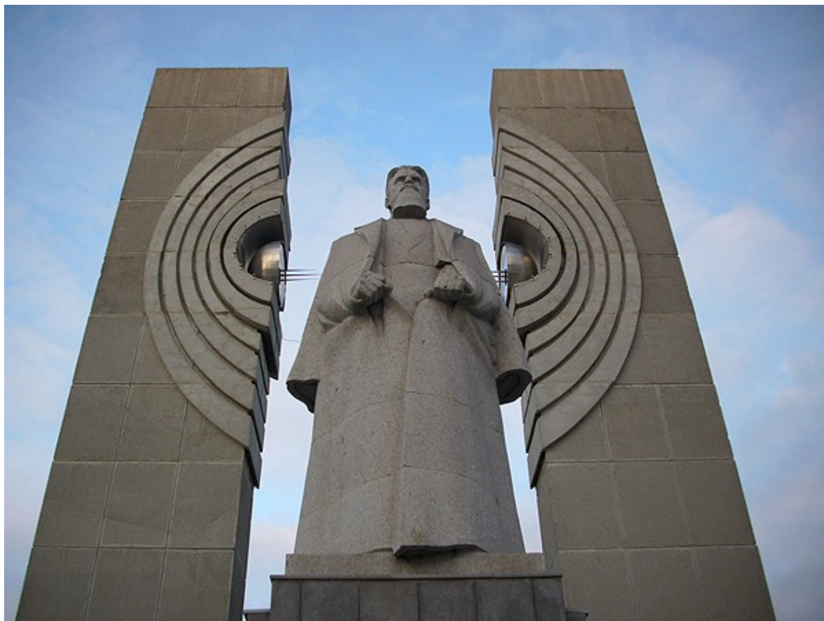
Памятник И. Курчатову