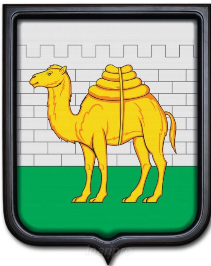
Герб города Челябинск