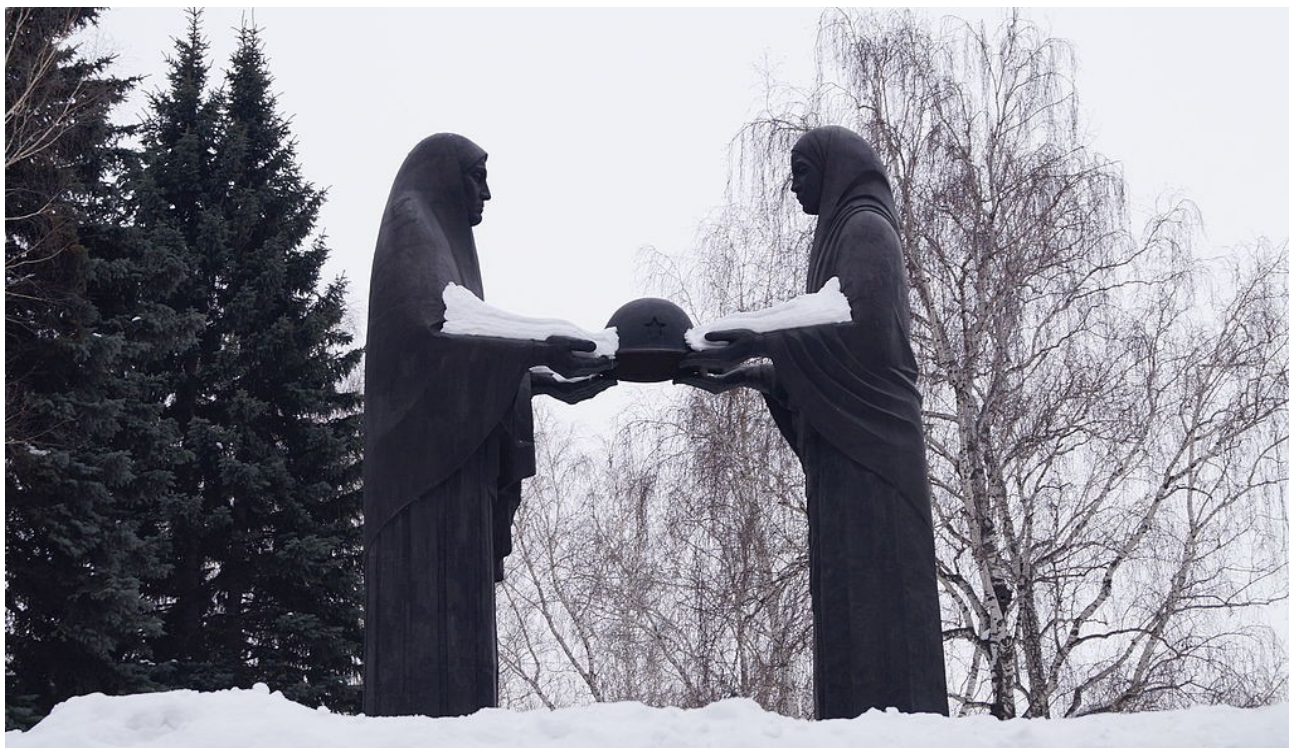
Памятник «Скорбящие Матери»