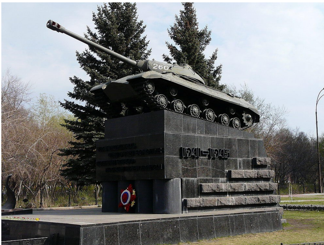
Памятник танку «ИС – 3»