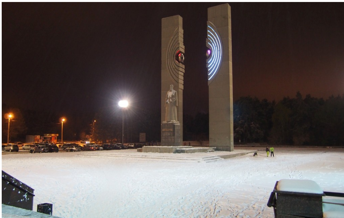
Реконструкция памятника И. Курчатову.