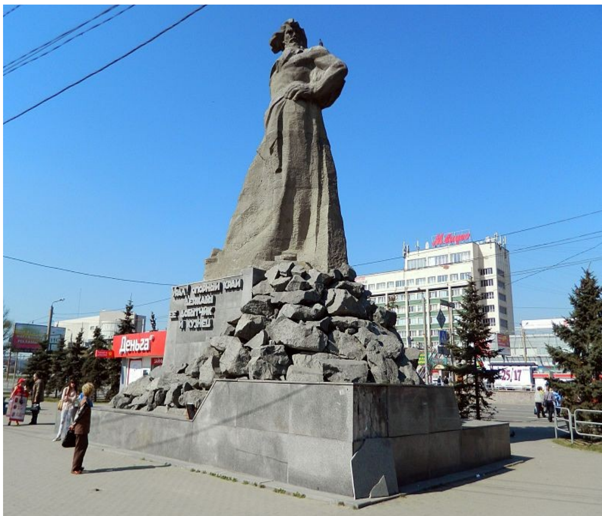
Памятник «Сказ об Урале»