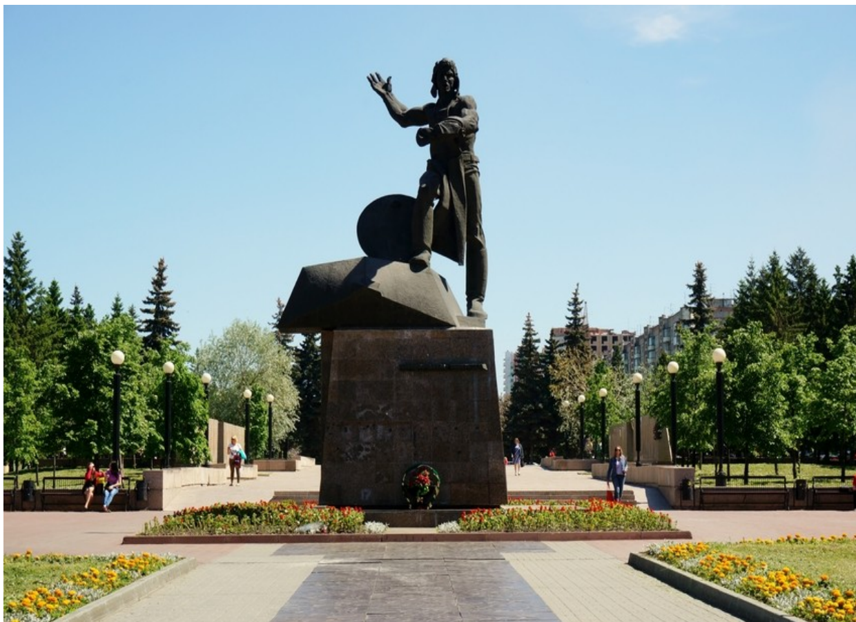
Памятник «Добровольцам – танкистам»