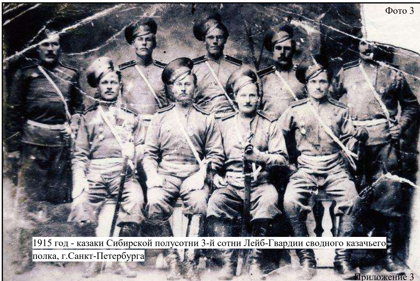
1915 год - казаки Сибирской полусотни 3-й сотни Лейб-Гвардии сводного казачьего полка, г.Санкт-Петербурга

«Три года состоял в первом разряде отличных стрельбищ, получив 3-й, 2-й и 1-й степени нагрудные знаки. На полковом состязании получил приз за стрельбу стоя, в виде серебряного карабина для ношения на груди.