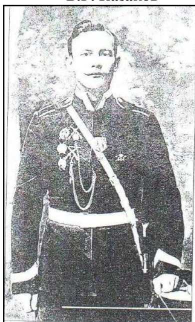
Старший урядник, отмеченный многими наградами. На правой стороне груди один под другим расположены знаки «За отличную стрельбу» 1-й, 2-й и 3-й степени, а также двое наградных часов за отличную стрельбу. На левой стороне груди — медали в честь 300-летия дома Романовых и полковой знак. Starshii urядnik displaying many distinctions. On the right side of the chest there are the badges «For excellent shooting» 1st, 2nd and 3rd class. The crossed rifles indicate award watches for marksmanship.