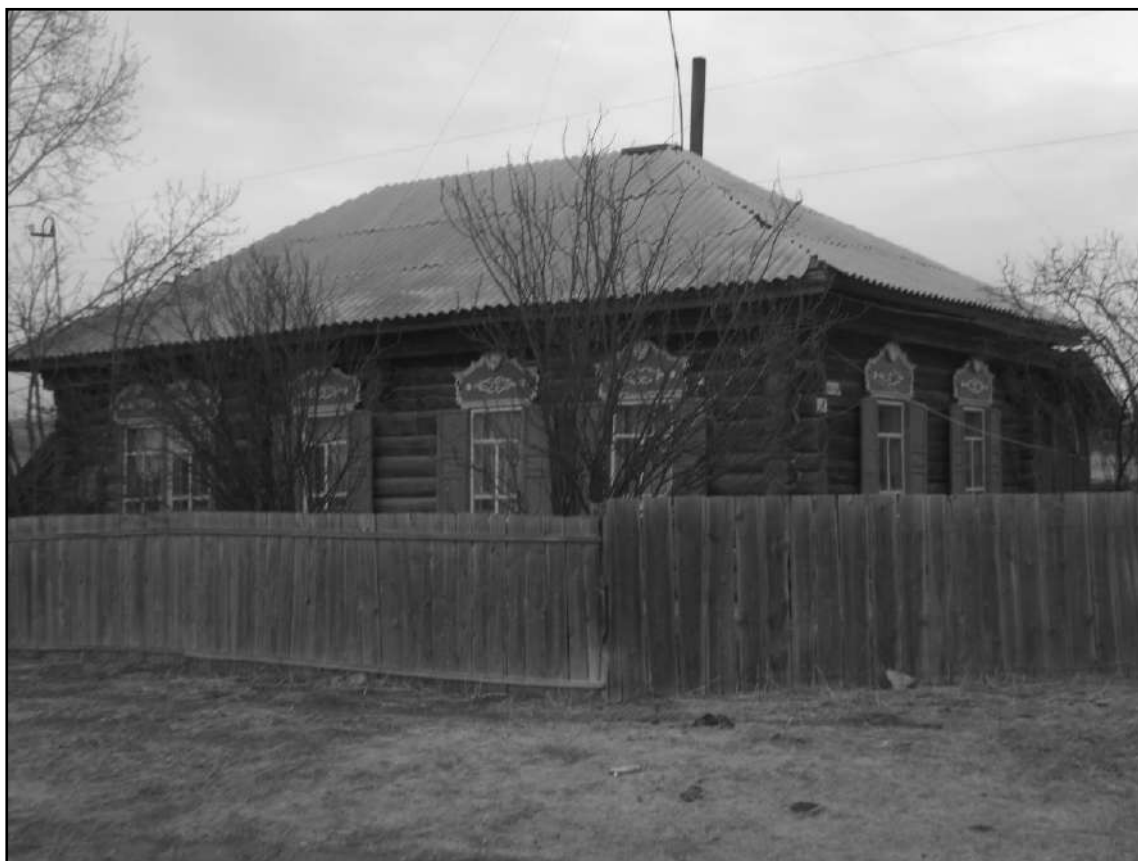
Дом семьи Казаковых