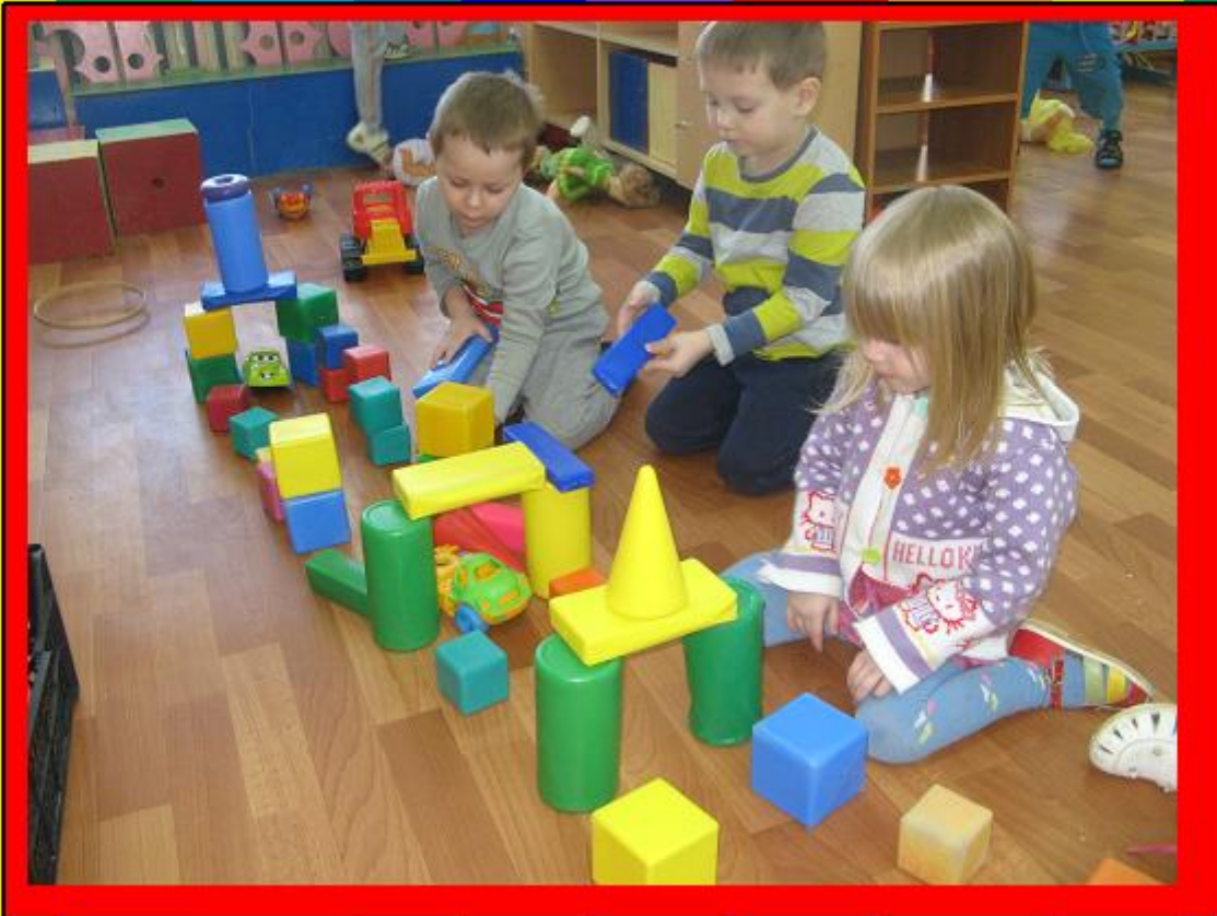
Строить замок и дорогу - Десять пальчиков помогут.