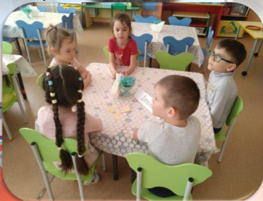
Соревнования двух команд «Лётчиков» и «Моряков»