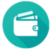
Основы финансовой грамотности