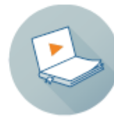
Видеоуроки от ИнтернетУрок