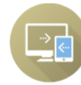
КПК «Цифровая образовательная среда»