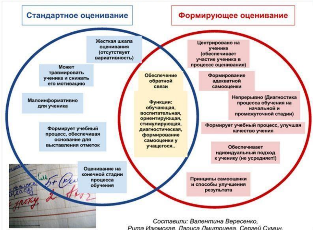
Диаграмма Венна для сравнения стандартизированного и формирующего оценивания