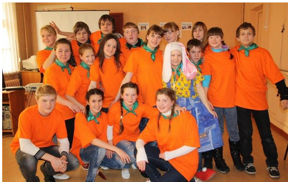
Наши в молодёжной общественной организации «Импульс»