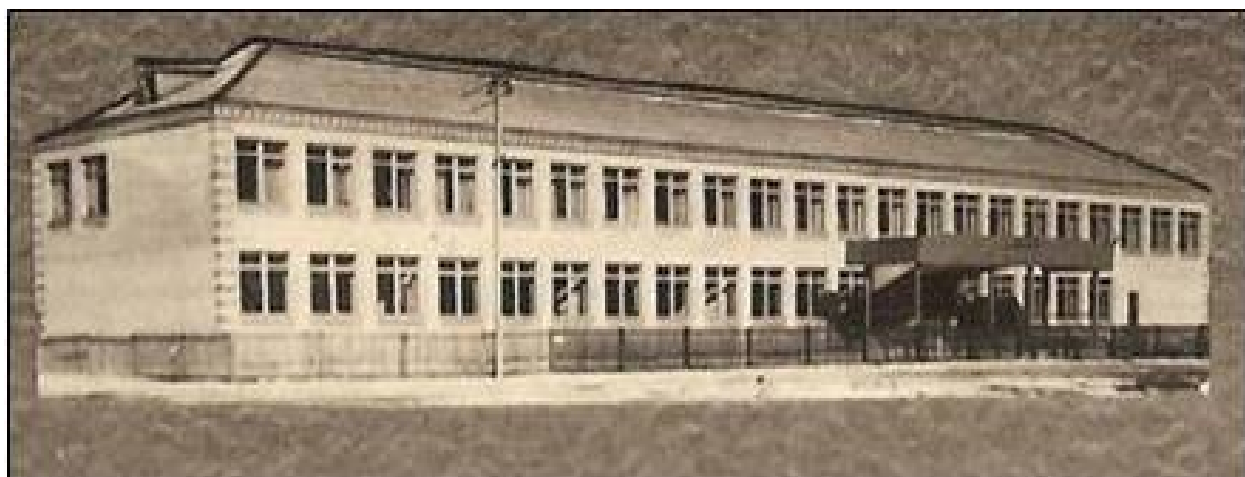
Старое и новое здание Еленинской школы