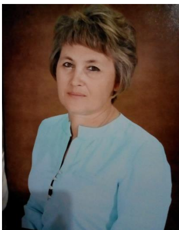
(фотопортрет 4×6 см)

Муниципальное бюджетное общеобразовательное учреждение Ёлкинская средняя общеобразовательная школа