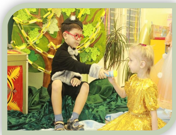
Педагогическое мероприятие «У Лукоморья»

- учить использовать оборудование и атрибуты для деятельности.