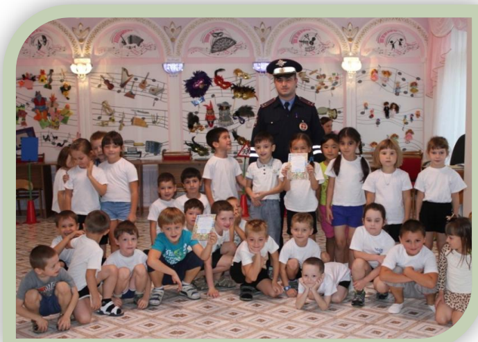
Встреча с инспектором ГИБДД

форму инспектора ГИБДД, проводит игры, конкурсы на знание правил дорожного движения.