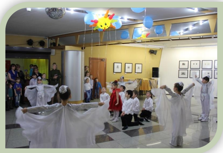
День Победы. Городской драматический театр

Постоянным партнёрам дошкольной образовательной организации является Городской драматический театр, который традиционно посещают воспитанники, воспитатели и родители. Театр выходного дня уже стал традиционным для всех семей, дети которых посещают дошкольную организацию. Дошкольники совместно с родителями (законными представителями) принимают активное участие во всех мероприятиях организованных театром. В прошлом году наши воспитанники выступали в рамках театральной субботы, представив посетителям театра концертные