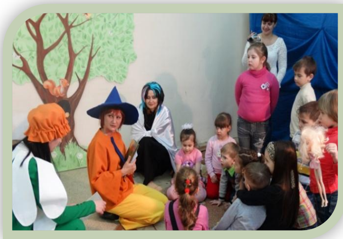
День города. Городская библиотека № 8

Таким образом, коммуникативная культура в значительной степени определяет компетентность всех участников образовательной деятельности и дает возможность обеспечить эффективное общение в ходе осуществления субъектного взаимодействия и развития, соответствующих личностно ориентированных взаимоотношений.