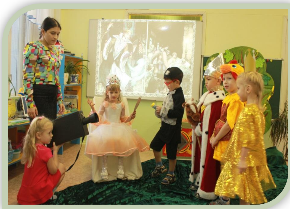
Педагогическое мероприятие «У Лукоморья»

Итак, завершая этап дошкольного образования, воспитанник должен быть: инициативным и самостоятельным в общении, уверенным в своих силах, открыт внешнему миру, положительно относиться к себе и к другим, обладать чувством собственного достоинства, быть способным взаимодействовать со сверстниками и взрослыми, участвовать в совместных играх. Среди целевых ориентиров отмечается способность договариваться, учитывать интересы и чувства других, сопереживать неудачам и радоваться успехам других, стараться разрешать конфликты, а также умение хорошо выражать свои мысли и желания.