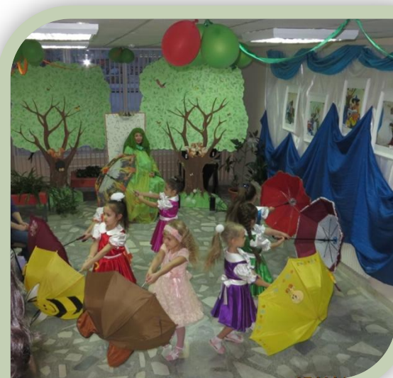
День матери. Городская библиотека № 8

художественной литературы педагоги нашей дошкольной образовательной организации решают в партнёрстве с городской детской библиотекой № 8. Мы используем фонд библиотеки для образовательной деятельности с