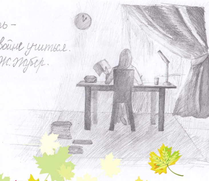
рис. Екатерины В. СМЕРНОВОЙ, 8а

Обучать - значит в двойне учиться. Ж. Жубер.