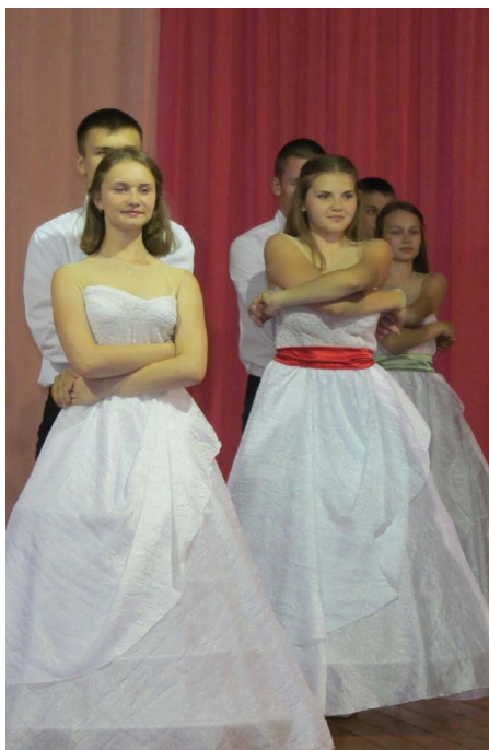
Выступление хореографического ансамбля «Новая версия»