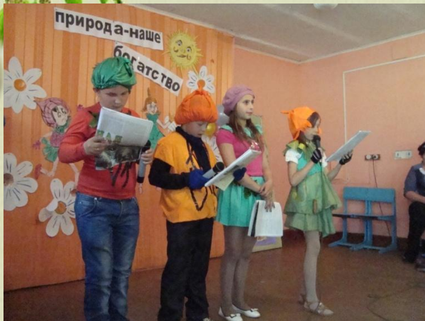
Спектакль «Природа – наше богатство»