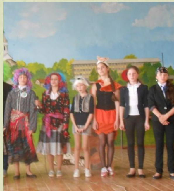
Экологический театр «Лесной спецназ»