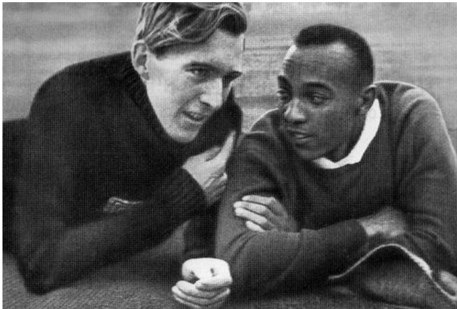
Лутц Лонг и Джесси Оуэнс