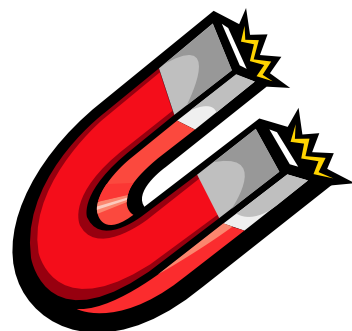
Пояснительная подпись под рисунком.

Lorem ipsum dolor sit amet, consectetur adipiscing elit, sed diam nonummy nibh euismod tincidunt ut lacreet dolore consec tetuer adipiscing elit, sed diam nonummy nibh euismod tincidunt ut lacreet dolore magna aliquam