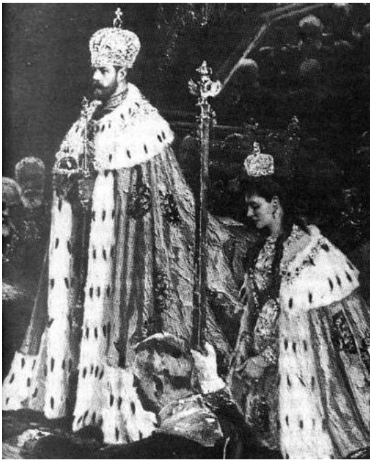
Коронация Николая II и Александры Фёдоровны. Москва, 1896