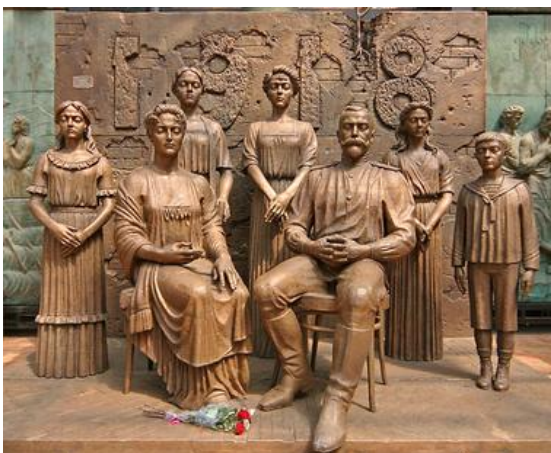
«Ипатьевская ночь». Памятник императорской семье в Тобольске

что наши чувства взаимны. Все в воле Божьей, уповая на его милосердие, я спокойно и покорно смотрю в будущее".