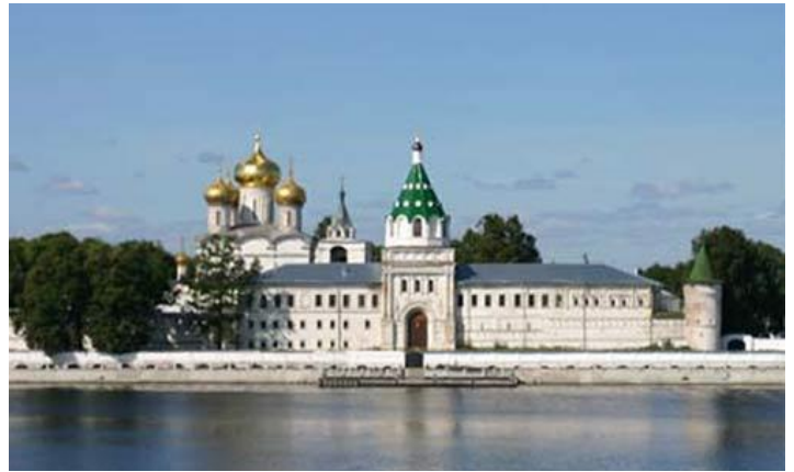
Свято-Троицкий Ипатьевский монастырь

Зайдя на территорию монастыря, мы увидим уникальные палаты бояр Романовых (кельи), в которых юный Михаил Романов скрывался от преследования поляков. Стилизация здания относится к 17 веку. Внутри расположена экспозиция «Колыбель Дома Романовых», где можно увидеть большое разнообразие старинных вещей, а особенную ценность представляют личные вещи бояр Романовых, главная из них - деревянный посох Михаила Романова. Этой постройке уже несколько сотен лет! О присутствии Романовых здесь напоминает и памятник