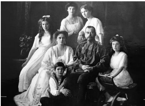
Императорская семья. 1917 год