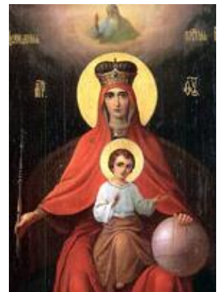
Икона Божией Матери, именуемая «Державная»

В день вынужденного отречения от престола Николая II в марте 1917 года была обретена в Коломенском в Церкви Вознесения, построенной в 1532 году в честь рождения Ивана Грозного, Икона Божией Матери, именуемая «Державная» как символ предстоящих всей стране испытаний и пробуждения духовной стороны в людях.