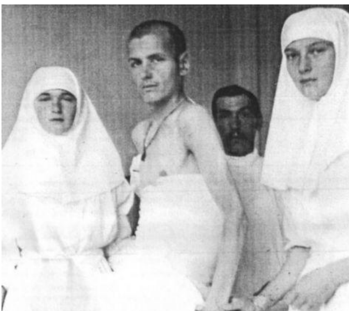
Великие княжны Ольга и Татьяна перевязывают раненого. Царское Село, 1914