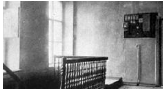
Лестница в подвал Ипатьевского дома, по которой царскую семью вели на убийство

Николай II пребывал на российском престоле 23 года и 23 ступени вели в подвал дома, где была убита царская семья.