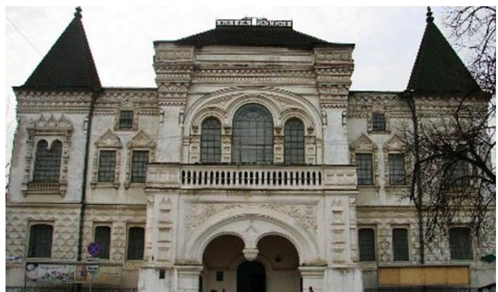
Костромской историко-архитектурный и художественный музей