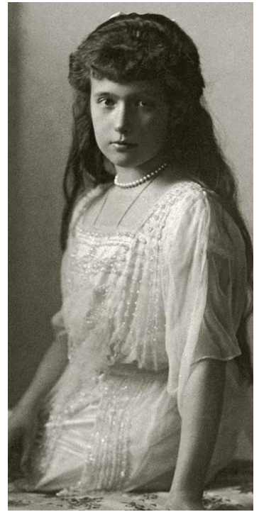
Великая княжна Мария Николаевна,, шеф 9-го драгунского Казанского полка (с 1912 по 1917 гг), и великая княжна Анастасия Николаевна

назвать русской красавицей. Высокая, полная, с соболиными бровями, с ярким румянцем на открытом русском лице, она особенно мила русскому сердцу. Смотришь на нее и невольно представляешь ее одетой в русский боярский сарафан, <...> а над высоким белым челом — кокошник с самокатным жемчугом. Ее глаза освещают все лицо особенным, лучистым блеском; они по временам кажутся черными, длинные ресницы бросают тень на яркий румянец ее нежных щек. Она весела и жива, но еще не проснулась для жизни; в ней, верно, таятся необъятные силы настоящей русской женщины».