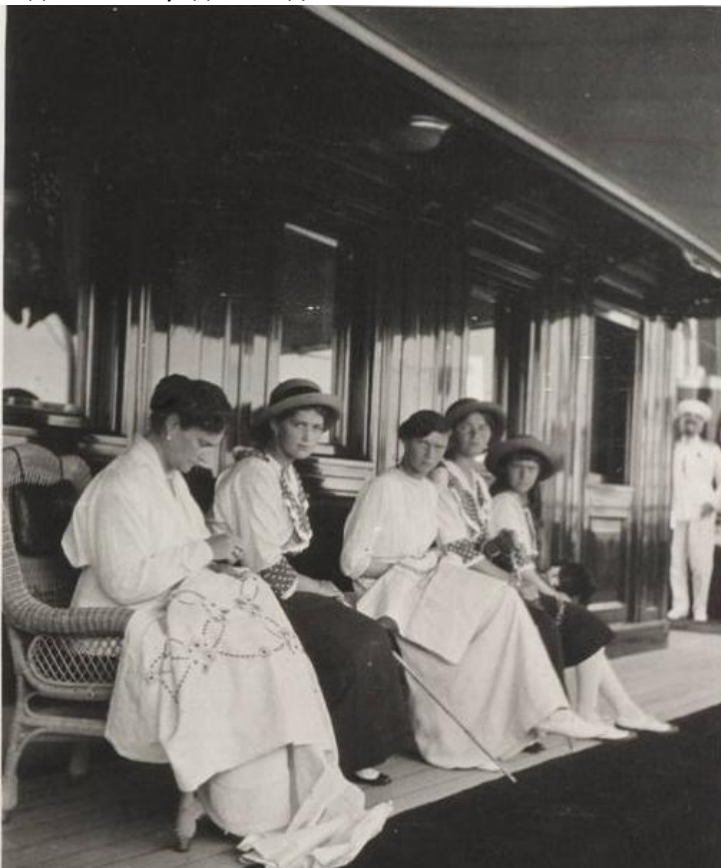
Императрица Александра Федоровна с дочерьми за рукоделием

Все вспоминают о том, что дочери царя, кроме, пожалуй, Татьяны Николаевны, мало думали о своем высоком положении, да и Татьяна обязы-