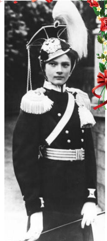
Великая княжна Ольга Николаевна, шеф Елисаветградского 3-го Гусарского полка (с 1909 по 1917 гг) и 2-го Кубанского пластунского батальона (с декабря 1916 по 1917 гг) и Великая княжна Татьяна Николаевна, шеф 8-го уланского Вознесенского полка (с 1911 по 1917 гг)

своими годами, но были юны в самом глубоком смысле этого слова — их радовало все: солнце, цветы, каждая минута, проведенная с отцом, каждая короткая прогулка, во время которой они могли посмотреть на толпу; радовались улыбкам незнакомых прохожих; сияли всем лаской и яркими красками цветущих лиц.