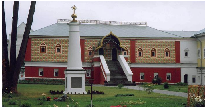
Палаты бояр Романовых в Ипатьевском монастыре