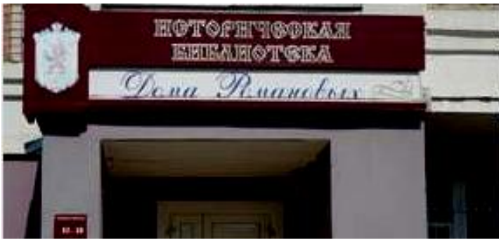
Историческая библиотека Дома Романовых