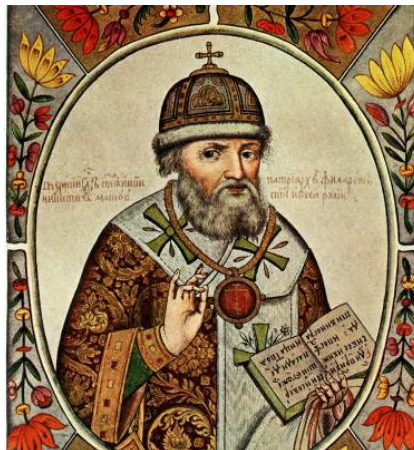
Патриарх Филарет (Фёдор Никитич Романов)