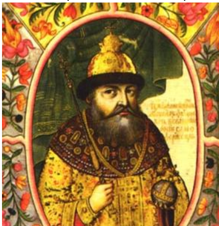
Лицевое изображение царя Михаила Фёдоровича Романова.

В его царствование и позже русские землепроходцы Василий Поярков и Ерофей Хабаров достигли Тихого океана близ устья Амура, создав опорные пункты для освоения Дальнего Востока.