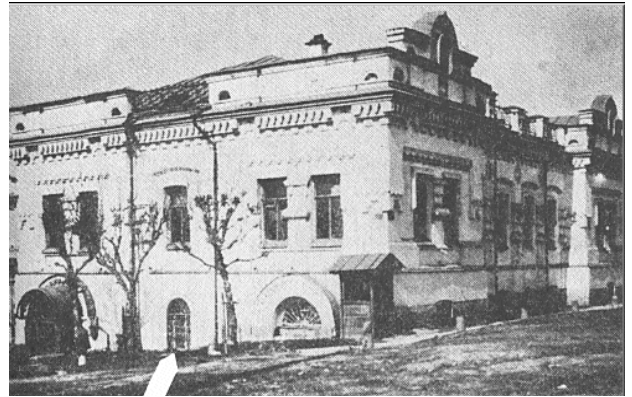
Дом Ипатьева с указанием места расстрела

В 1613 году первый царь из рода Романовых – Михаил Романов был призван на царство в Ипатьевском монастыре в Костроме, а через 305 лет, в 1918 году, последний русский царь – Николай II – был расстрелян с семьей в Ипатьевском доме в Екатеринбурге.